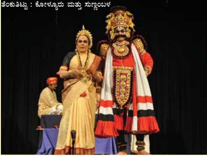
ತೆಂಕುತಿಟ್ಟು : ಕೋಳೂರು ಮತ್ತು ಸುಣ್ಣಂಬಳ