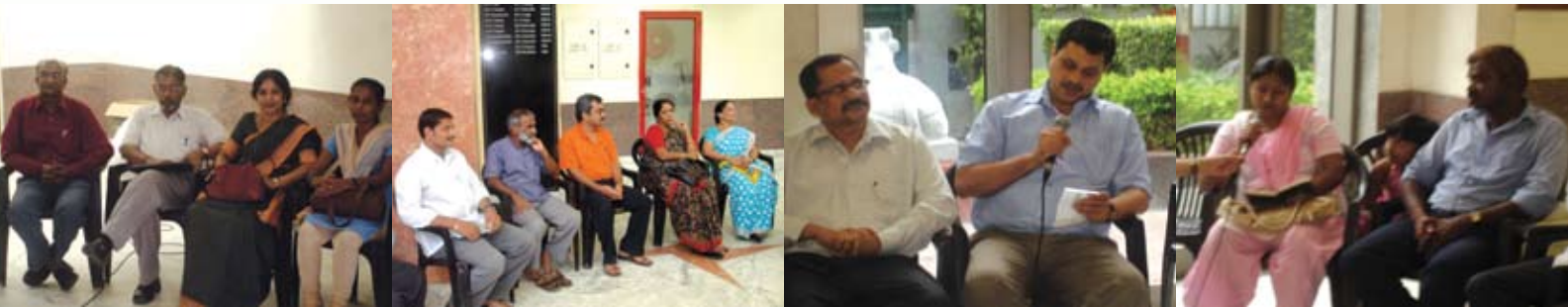
ಸಂಘದ ಅಂಗಳದಲ್ಲಿ ಕಾವ್ಯದ ಕೆಲವು ದೃಶ್ಯಾವಳಿಗಳು