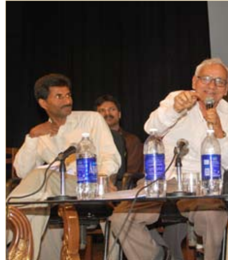
ನಾಟಕದ ನಂತರದ ಚರ್ಚೆಯಲ್ಲಿ ನಾಟಕಕಾರ

ಎಲ್ಲಾ ಹಕ್ಕುಗಳನ್ನು ಕಳೆದುಕೊಳ್ಳುವನು. ಅದನ್ನು ಧನವಂತರಾವ್ ತನ್ನ ವಕೀಲನ ಮುಖಾಂತರ ಸತ್ಯವಂತರಾವ್ 14 ವರ್ಷಗಳಿಂದ ಕಾಣಿಯಾದುದರಿಂದ ಎರಡು ಬಾರಿ ಸತ್ತಿರುವನು ಎಂದು ವಾದಿಸುವನು. ಅಂತಿಮವಾಗಿ ವಿವೇಕರಾವ್ ಅವರು ಸತ್ಯವಂತರಾವ್ ಅವರನ್ನು 'ತಾವು ಈ ಹದಿನಾಲ್ಕು ವರ್ಷಗಳ ಕಾಲ ಎಲ್ಲ ಮಾಯವಾಗಿದ್ದಿರಿ' ಎಂದು ಕೇಳಿದಾಗ ನಡೆದ ನಿಜ ಸಂಗತಿಯನ್ನು ನ್ಯಾಯಾಲಯದ ಮುಂದೆ ಹೇಳುವನು. 1948ರ ಜನವರಿ ಮೂರನೇ ವಾರ ಮಹಾತ್ಮ ಗಾಂಧೀ ಅವರನ್ನು ಕಾಣಲು ನವದೆಹಲಿಗೆ ಹೋದ. ಅಲ್ಲಿ ಅವರ ದರ್ಶನ ಪಡೆದು ಪ್ರತಿದಿನ ಅಲ್ಲಿ ನಡೆಯುವ