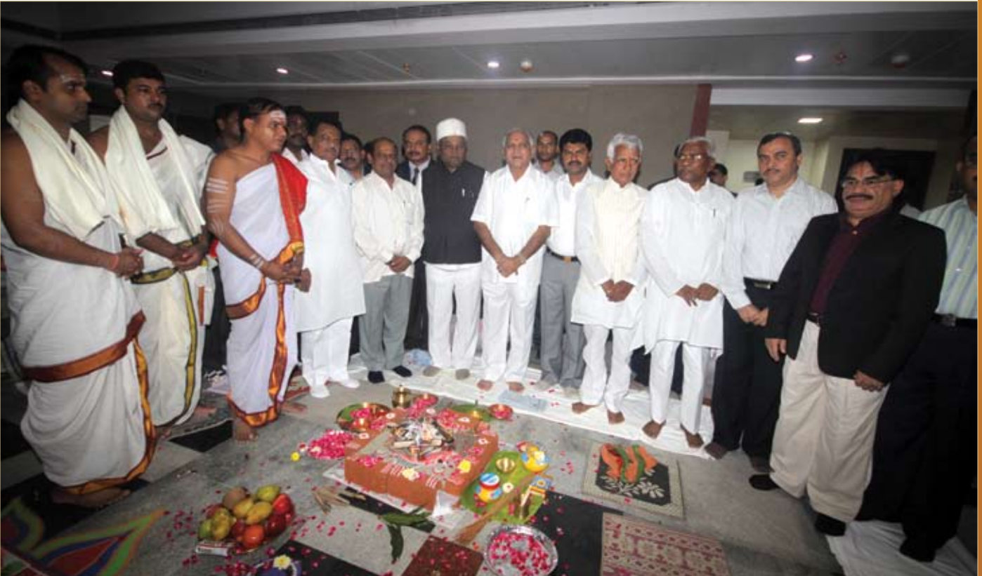
ಅನೆಕ್ಸ್ ಕಟ್ಟಡ ಉದ್ಘಾಟನಾ ಪೂರ್ವ ಪೂಜೆಯಲ್ಲಿ ಕರ್ನಾಟಕದ ಮುಖ್ಯಮಂತ್ರಿಗಳು, ಸಂಪುಟದ ಸಚಿವರುಗಳು ಹಾಗೂ ಕರ್ನಾಟಕ ಭವನದ ಅಧಿಕಾರಿಗಳು ಮತ್ತು ಸಿಬ್ಬಂದಿ ವರ್ಗ