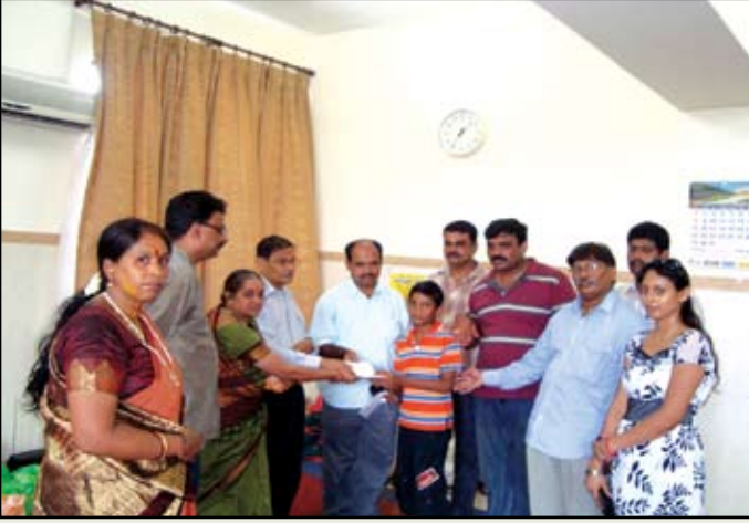
ವಿದ್ಯಾರ್ಥಿ ವೇತನ ವಿತರಣೆ