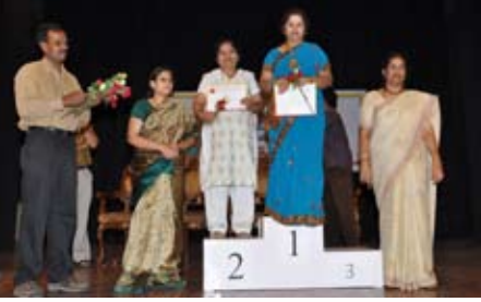
ಬಕೆಟ್‌ಗೆ ಚೆಂಡು ಹಾಕುವ ಸ್ಪರ್ಧೆ ವಿಜೇತರು