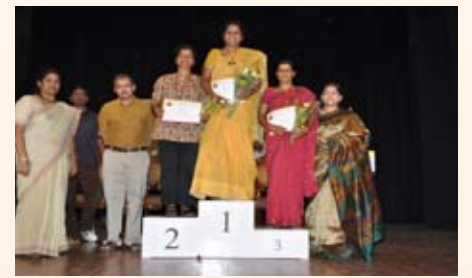
200 ಮೀಟರ್ ವೇಗ ನಡಿಗೆ ಸ್ಪರ್ಧೆ ವಿಜೇತರು