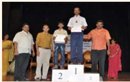
200 ಮೀಟರ್ ವೇಗ ನಡಿಗೆ ಸ್ಪರ್ಧೆ ವಿಜೇತರು