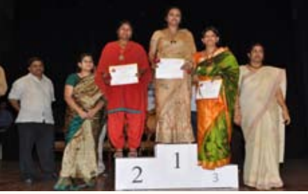
ಲಿಂಬೆ ಮತ್ತು ಚಮಚ (31-40 ವರ್ಷ) ಸ್ಪರ್ಧೆ ವಿಜೇತರು