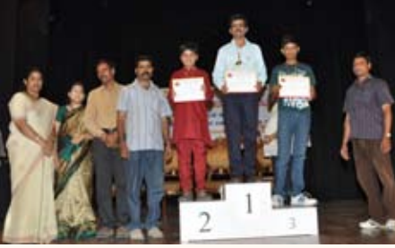
ಭಾವಗೀತೆ ಸ್ಪರ್ಧೆ ವಿಜೇತರು