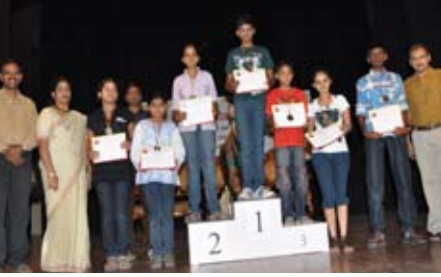
ಸ್ಮರಣ ಶಕ್ತಿ ಪರೀಕ್ಷೆ (10-14 ವರ್ಷ) ಸ್ಪರ್ಧೆ ವಿಜೇತರು