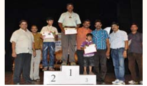
200 ಮೀಟರ್ ಓಟ ಸ್ಪರ್ಧೆ ವಿಜೇತರು