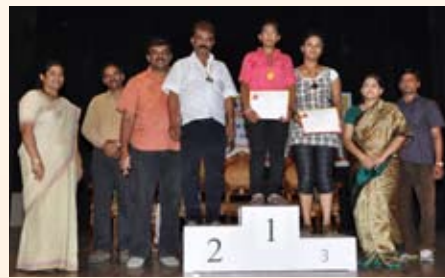
200 ಮೀಟರ್ ಓಟ (15-20 ವರ್ಷ) ಸ್ಪರ್ಧೆ ವಿಜೇತರು