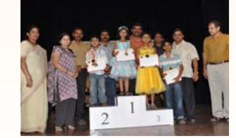
ಚಿತ್ರ ಬರೆಯುವ ಸ್ಪರ್ಧೆ(6-9 ವರ್ಷ) ವಿಜೇತರು