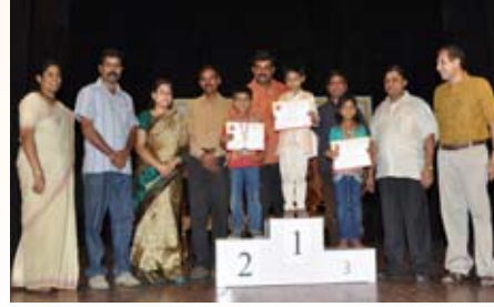
ಚಿತ್ರ ಬರೆಯುವ (3-5ವರ್ಷ) ಸ್ಪರ್ಧೆ ವಿಜೇತರು