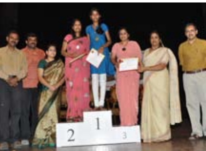
ಕೇರಂ ಸಿಂಗಲ್ಸ್ (ಮಹಿಳೆಯರು) ವಿಜೇತರು