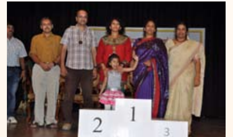
ಕ್ವಿಜ್ ಸ್ಪರ್ಧೆ ತೃತೀಯ ಸ್ಥಾನ