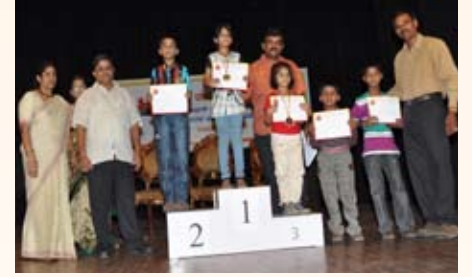
ಸ್ಮರಣ ಶಕ್ತಿ ಪರೀಕ್ಷೆ (7-10ವರ್ಷ) ಸ್ಪರ್ಧೆ ವಿಜೇತರು