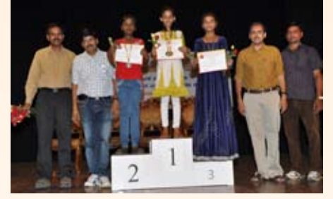
ಮ್ಯೂಸಿಕಲ್ ಚೇರ್ (6-12ವರ್ಷ) ಸ್ಪರ್ಧೆ ವಿಜೇತರು