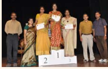
ಶಾಟ್‌ಪುಟ್ ಸ್ಪರ್ಧೆ ವಿಜೇತರು