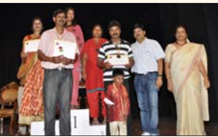
ಸೂಜಿಗೆ ದಾರ ಹಾಕುವ ಸ್ಪರ್ಧೆ ವಿಜೇತರು