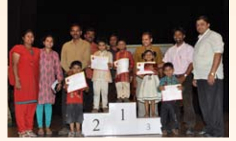
ಭದ್ರವೇಷ (3-6ವರ್ಷ) ಸ್ಪರ್ಧೆ ವಿಜೇತರು