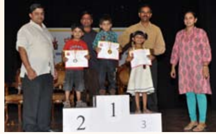
ಕನ್ನಡ ರೈಮ್ಸ್ ಸ್ಪರ್ಧೆ ವಿಜೇತರು