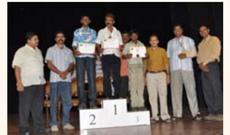
100 ಮೀಟರ್ ಓಟ (12-15 ವರ್ಷ) ಸ್ಪರ್ಧೆ ವಿಜೇತರು