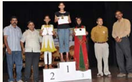
100 ಮೀಟರ್ ಓಟ (9-11 ವರ್ಷ) ಸ್ಪರ್ಧೆ ವಿಜೇತರು