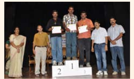
ಶಾಟ್ ಪುಟ್ (21-39ವರ್ಷ) ಸ್ಪರ್ಧೆ ವಿಜೇತರು