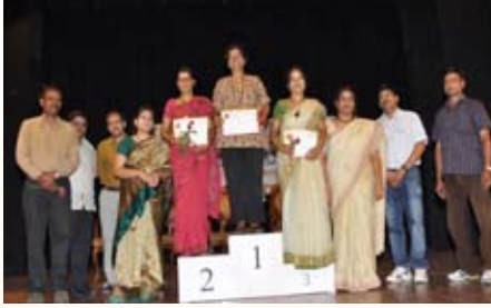
ಲಿಂಬೆ ಮತ್ತು ಚಮಚ (40 ವರ್ಷ ಮೇಲ್ಪಟ್ಟ) ಸ್ಪರ್ಧೆ ವಿಜೇತರು