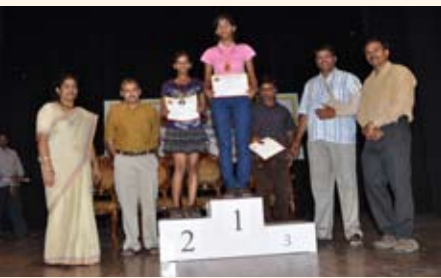
100 ಮೀಟರ್ ಓಟ (12-15 ವರ್ಷ) ಸ್ಪರ್ಧೆ ವಿಜೇತರು