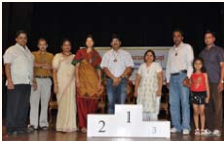
ಕ್ವಿಜ್ ಸ್ಪರ್ಧೆ ದ್ವಿತೀಯ ಸ್ಥಾನ