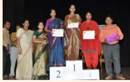
ರಂಗೋಲಿ ಸ್ಪರ್ಧೆ ವಿಜೇತರು