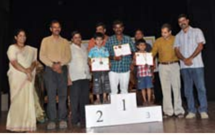
50 ಮೀಟರ್ ಓಟ (3-5ವರ್ಷ) ಸ್ಪರ್ಧೆ ವಿಜೇತರು