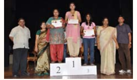
ಲಿಂಬೆ ಮತ್ತು ಚಮಚ (21-30 ವರ್ಷ) ಸ್ಪರ್ಧೆ ವಿಜೇತರು