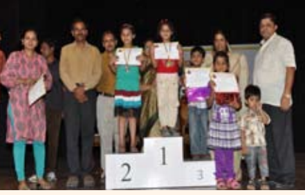
ಭದ್ರವೇಷ (6-10ವರ್ಷ) ಸ್ಪರ್ಧೆ ವಿಜೇತರು