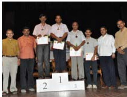
ಕೇರಂ ಸಿಂಗಲ್ಸ್ ಮತ್ತು ಡಬಲ್ಸ್ ವಿಜೇತರು