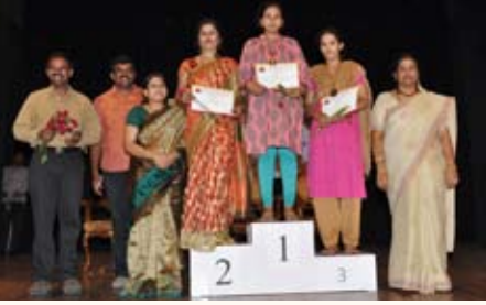
ಮ್ಯೂಸಿಕಲ್ ಚೇರ್ ಸ್ಪರ್ಧೆ ವಿಜೇತರು