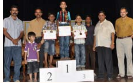
50 ಮೀಟರ್ ಓಟ (6-8 ವರ್ಷ) ಸ್ಪರ್ಧೆ ವಿಜೇತರು