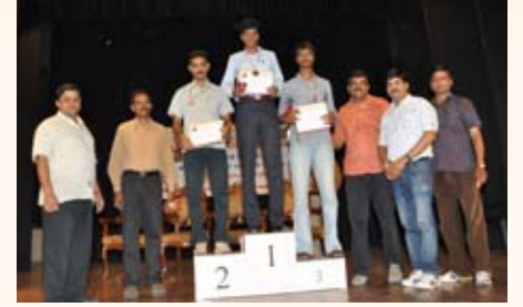
200 ಮೀಟರ್ ಓಟ ಸ್ಪರ್ಧೆ ವಿಜೇತರು