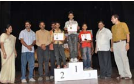
100 ಮೀಟರ್ ಓಟ (9-11 ವರ್ಷ) ಸ್ಪರ್ಧೆ ವಿಜೇತರು