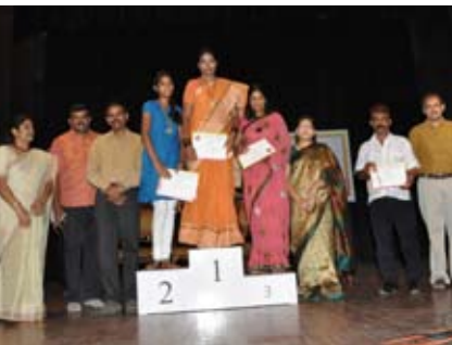
ಕೇರಂ ಡಬಲ್ಸ್ (ಮಹಿಳೆಯರು) ವಿಜೇತರು