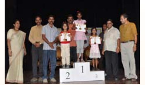
50 ಮೀಟರ್ ಓಟ (6-8 ವರ್ಷ) ಸ್ಪರ್ಧೆ ವಿಜೇತರು