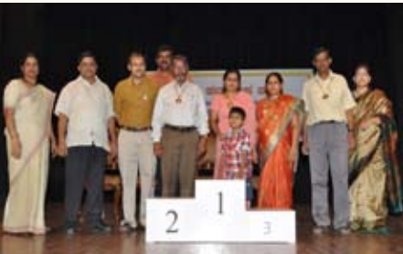
ಕ್ವಿಜ್ ಸ್ಪರ್ಧೆ ಪ್ರಥಮ ಸ್ಥಾನ