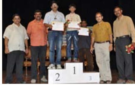
ಬಕೆಟ್‌ಗೆ ಚೆಂಡು ಹಾಕುವ ಸ್ಪರ್ಧೆ ವಿಜೇತರು