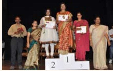
100 ಮೀಟರ್ ಓಟ ಸ್ಪರ್ಧೆ ವಿಜೇತರು