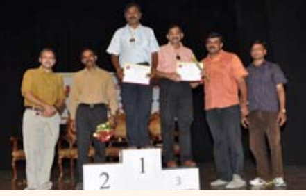
ಶಾಟ್ ಪುಟ್ ಸ್ಪರ್ಧೆ ವಿಜೇತರು