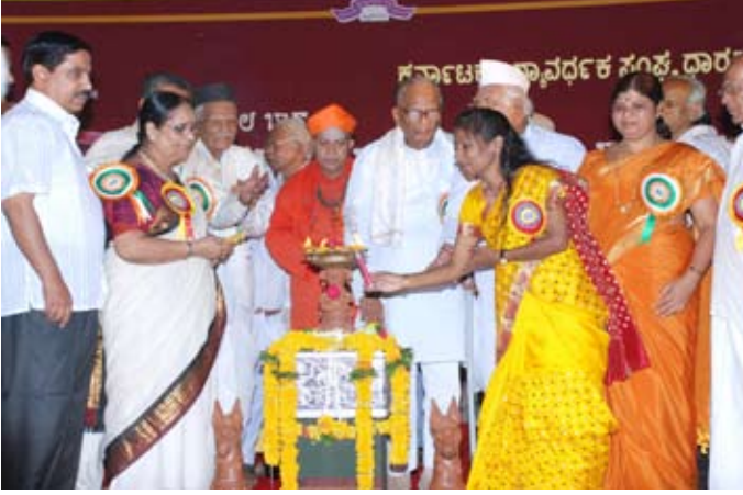
ನಾಡೋಜಿ ಡಾ. ಪಾಟೀಲ ಪುಟ್ಟಪ್ಪನವರಿಂದ ಸಮ್ಮೇಳನದ ಉದ್ಘಾಟನೆ

ಮೇ 30 ಮತ್ತು 31, 2010 "ಅಖಿಲ ಭಾರತ ಹೊರನಾಡ ಕನ್ನಡಿಗರ ಸಮ್ಮೇಳನವನ್ನು" "ಕರ್ನಾಟಕ ವಿದ್ಯಾವರ್ಧಕ ಸಂಘ" ಧಾರವಾಡ ಹಾಗೂ ಕನ್ನಡ ಮತ್ತು ಸಂಸ್ಕೃತಿ ಇಲಾಖೆ, ಬೆಂಗಳೂರು ಇವರ ಸಹಯೋಗದೊಂದಿಗೆ ನಡೆಯಿತು. ಈ ಸಂದರ್ಭದಲ್ಲಿ "ಹೊರನಾಡ ಕನ್ನಡಿಗರ ಸಮಸ್ಯೆಗಳು-ಪರಿಹಾರಗಳು ಅಂದು-ಇಂದು-ಮುಂದು ಚಿಂತನೆ" ಎನ್ನುವ ವಿಷಯದಲ್ಲಿ 2 ದಿನಗಳ ವಿಚಾರಗೋಷ್ಠಿ ಕಾರ್ಯಕ್ರಮವನ್ನು ಏರ್ಪಡಿಸಿದರು. ಇದರಲ್ಲಿ ದೇಶದ ವಿವಿಧ ಭಾಗಗಳಿಂದ ಬಂದ ಸಾಧಾರಣ 600 ಜನ ಪ್ರತಿನಿಧಿಗಳು ಭಾಗವಹಿಸಿದ್ದರು. 30.05.2010ರಂದು ಬೆಳಿಗ್ಗೆ 10.30ಕ್ಕೆ ಉದ್ಘಾಟನಾ ಸಮಾರಂಭವನ್ನು ಶ್ರೀ ತರಳುಬಾಳು ಪೂಜ್ಯ ಜಗದ್ಗುರು ಡಾ. ಶಿವಮೂರ್ತಿ ಶಿವಾಚಾರ್ಯ ಸ್ವಾಮಿಗಳ ಸಾನ್ನಿಧ್ಯದಲ್ಲಿ ನಾಡೋಜಿ ಡಾ. ಪಾಟೀಲ ಪುಟ್ಟಪ್ಪನವರ ಅಧ್ಯಕ್ಷತೆಯಲ್ಲಿ ಘನತೆವೆತ್ತ ಶ್ರೀ ಹಂಸರಾಜ ಭಾರದ್ವಾಜ, ರಾಜ್ಯಪಾಲರು, ಕರ್ನಾಟಕ ಸರ್ಕಾರ, ಇವರಿಂದ ಕಾರ್ಯಕ್ರಮ ವಿಜೃಂಭಣೆಯಿಂದ ಜ್ಯೋತಿ ಬೆಳಗಿಸುವ ಮೂಲಕ ಉದ್ಘಾಟಿಸಲ್ಪಟ್ಟಿತು.