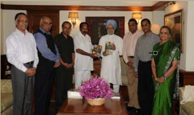
ಡಾ. ವೀರಪ್ಪ ಮೊಯಿಲಯವರು ಪ್ರಧಾನಮಂತ್ರಿಗಳಿಗೆ ಕೃತಿಯನ್ನು ನೀಡಿದಾಗ

ನವದೆಹಲಿಯ ಸಾಯಿ ಇಂಟರ್ನ್ಯಾಶನಲ್‌ನಲ್ಲಿ ನಡೆದ ಕಾರ್ಯಕ್ರಮದಲ್ಲಿ ಕೇಂದ್ರ ಕಾನೂನು ಹಾಗೂ ನ್ಯಾಯ ಮಂತ್ರಿಗಳಾದ ಸನ್ಮಾನ್ಯ ಡಾ. ವೀರಪ್ಪ ಮೊಯಿಲಯವರ "ಶ್ರೀ ರಾಮಾಯಣ ಮಹಾನ್ವೇಷಣಂ The great quest of Ramayana" ಎಂಬ ಪುಸ್ತಕ ಬಿಡುಗಡೆ ಸಮಾರಂಭದಲ್ಲಿ ಭಾರತದ ಮುಖ್ಯ ನ್ಯಾಯಾಧೀಶರಾದ ಜಸ್ಟೀಸ್ ಸರೋಶ್ ಹೋಮಿ ಕಪಾಡಿಯಾ ಅವರು ಮಾತನಾಡುತ್ತಾ— "ಧರ್ಮದಲ್ಲಿರುವ ತತ್ವಗಳನ್ನು ಅಳವಡಿಸಿಕೊಂಡರೆ, ಭಾರತದ ಏಳಿಗೆ ಹಾಗೂ ಉನ್ನತಿ ಸಾಧ್ಯ" ಎಂದು ಒತ್ತಿ ಹೇಳಿದರು.