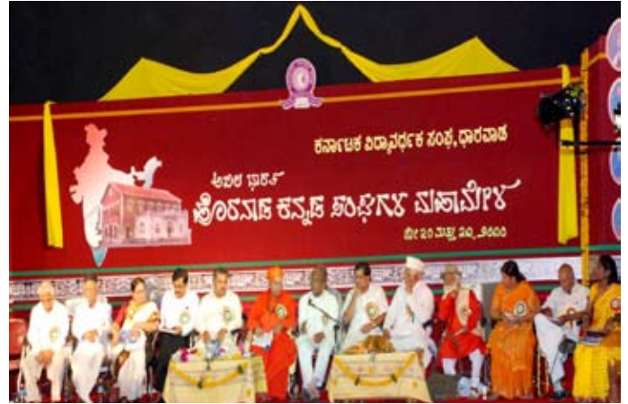
ಎರಡು ದಿನಗಳ ವಿಚಾರಗೋಷ್ಠಿ