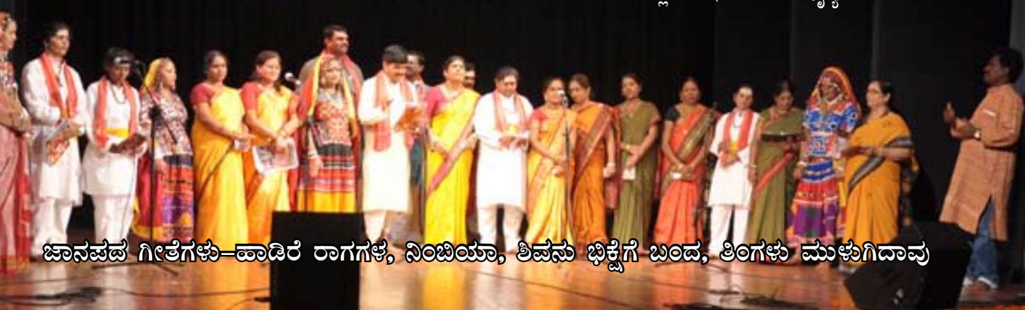
ಜಾನಪದ ಗೀತೆಗಳು-ಹಾಡಿರೆ ರಾಗಗಳ, ನಿಂಬಿಯಾ, ಶಿವನು ಭಿಕ್ಷೆಗೆ ಬಂದ, ತಿಂಗಳು ಮುಳುಗಿದಾವು