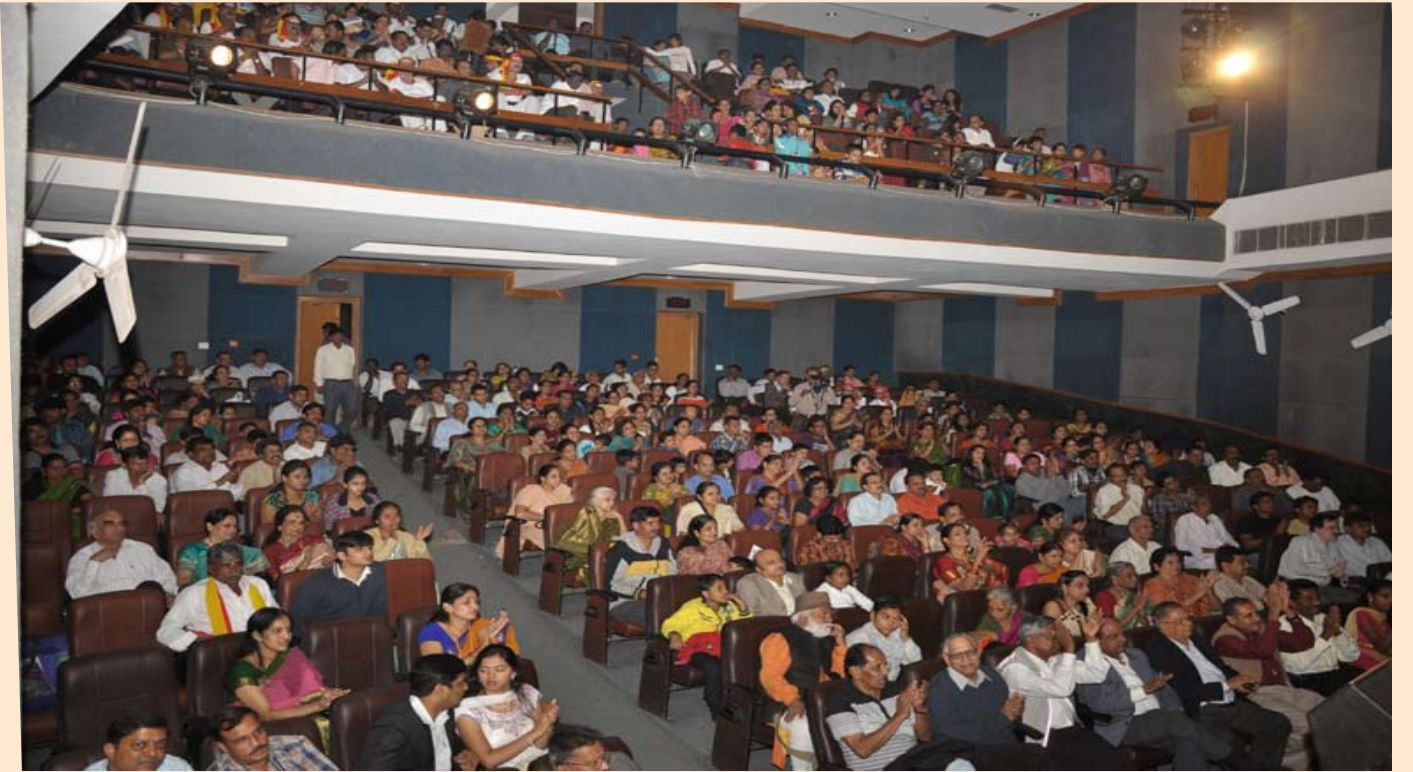
ಸಾಂಸ್ಕೃತಿಕ ಕಾರ್ಯಕ್ರಮಗಳನ್ನು ಸಂಭ್ರಮಿಸುತ್ತಿರುವ ದೆಹಲಿ ಕನ್ನಡಿಗರು