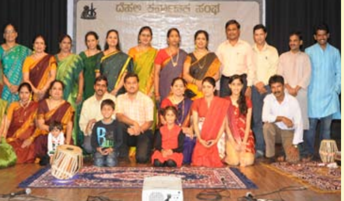
ಬೇಂದ್ರೆ ಗೀತಗಾಯನ ಕಾರ್ಯಕ್ರಮ ಪ್ರಸ್ತುತಪಡಿಸಿದ ದೆಹಲಿ ಕಲಾವಿದರು