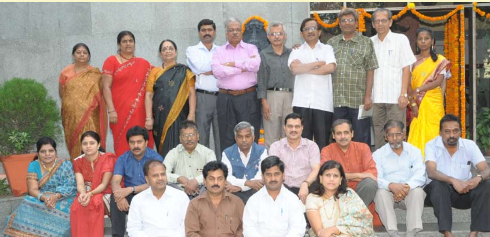
ಬೇಂದ್ರೆ ಕಾರ್ಯಕ್ರಮಕ್ಕೆ ಆಗಮಿಸಿದ ಕರ್ನಾಟಕದ ವಿದ್ವಾಂಸರೊಂದಿಗೆ ದೆಹಲಿ ಕನ್ನಡಿಗರು