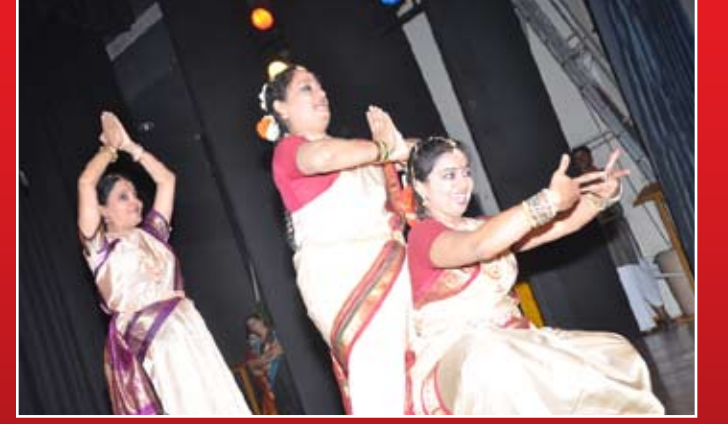
ನರ್ತಿಸು ತಾಯೆ-ಸಮೂಹ ನೃತ್ಯ