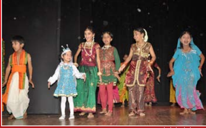
ಮಕ್ಕಳ ನೃತ್ಯ . . ಎಲೆಗಳು ನೂರಾರು