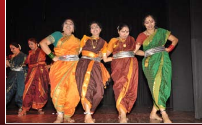
ಚಿಲ್ಲಿದರು ಮಲ್ಲಿಗೆಯಾ-ಜಾನಪದ ನೃತ್ಯ