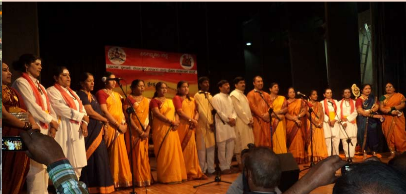
ಸುಗಮ ಸಂಗೀತ-ಒಂದೆ ಒಂದೇ ಕರ್ನಾಟಕ ಒಂದೇ, ವಿಶ್ವವಿನೂತನ, ತಾಯೆ ಬಾರ ಮೊಗವ ತೋರ, ಬಾರಿಸು ಕನ್ನಡ ಡಿಂಡಿಮವ