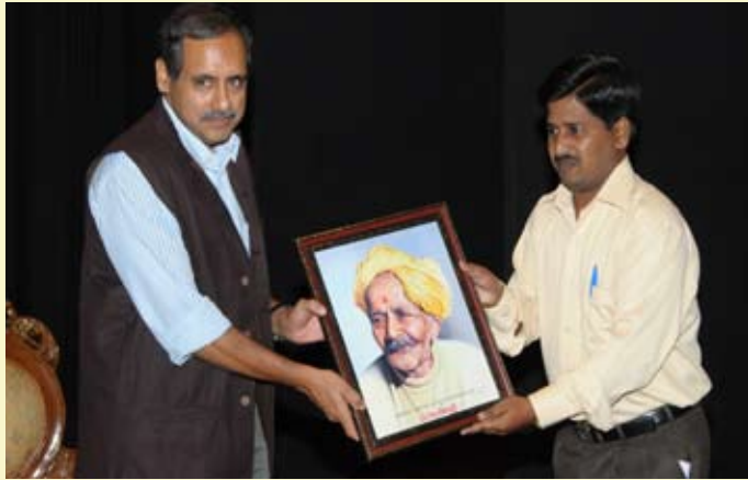
ಸಂಘಕ್ಕೆ ವರಕವಿ ಬೇಂದ್ರೆ ಅವರ ಭಾವಚಿತ್ರ

ನವೆಂಬರ್ 5, ಸಾಯಂಕಾಲ ಸಂಘದ ಸಭಾಂಗಣದಲ್ಲಿ 'ವರಕವಿ ದ.ರಾ. ಬೇಂದ್ರೆ-ನೆನಪು' ಕಾರ್ಯಕ್ರಮವನ್ನು ನಾಡಿನ ಮಹತ್ವದ ಕವಿ, ಎಚ್.ಎಸ್. ವೆಂಕಟೇಶ ಮೂರ್ತಿಯವರು ದೀಪ ಬೆಳಗಿಸುವುದರ ಮೂಲಕ ಉದ್ಘಾಟಿಸಿ ಮಾತನಾಡಿದರು. ಬೇಂದ್ರೆ ಕಾವ್ಯದ ಮುಖಾಮುಖಿಯಾದ ಸ್ಮರಣೆಗಳನ್ನು ಹಂಚಿಕೊಂಡ ಎಚ್.ಎಸ್. ವೆಂಕಟೇಶ ಮೂರ್ತಿ ವರಕವಿ ಬೇಂದ್ರೆ ಕಾವ್ಯ ಅವರ ಬದುಕಿನ ನೋವು, ನಲಿವು, ವೈಯಕ್ತಿಕ ಅನುಭವಗಳಿಂದ ಕೂಡಿದುದಾಗಿದೆ. ಇಲ್ಲಿ ಅರ್ಥ ಮುಖ್ಯವಲ್ಲ ಅನುಭವ ಮುಖ್ಯ ಎಂದ ಅವರು ಬೇಂದ್ರೆ ಕವಿ ಮಾತ್ರ ಆಗಿರದೇ ಸ್ವಾನುಭವವುಳ್ಳ ಸಮರ್ಥ ಹಾಡುಗಾರ ಕೂಡ ಎಂದು ನೆನೆದರು. "ಬೇಂದ್ರೆ ಅವರು ಕಳೆದ ಶತಮಾನದ ಸಾಹಿತ್ಯ ಸಂದರ್ಭದ ವಿಸ್ಮಯ. ರಸಪ್ರಜ್ಞೆಯೇ ಅವರ ಕವಿತೆಗಳ ಮಹತ್ವದ ಗುಣ ಕೇವಲ ಕಥನ ಮಾತ್ರವಲ್ಲದೇ ಭಾವನಾ ಪ್ರಧಾನವಾದ ಹೊಸ ಲಯವನ್ನು ಸೃಷ್ಟಿಸಿದ ಏಕೈಕ ಶುಭ್ರಾಂಡ ಭಾವಗೀತಕಾರ. ಅವರ ಖಾಸಗಿ ಬದುಕಿನ ಕ್ಷಣಗಳು ಶ್ರೇಷ್ಠ ಕಾವ್ಯಕ್ಕೆ ಮುನ್ನುಡಿ