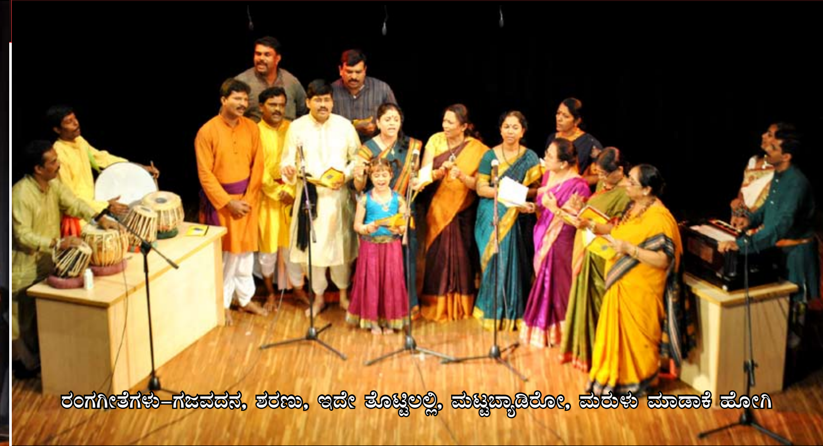
ರಂಗಗೀತೆಗಳು-ಗಜವದನ, ಶರಣು, ಇದೇ ತೊಟ್ಟಿಲ್ಲಲ್ಲಿ, ಮಟ್ಟಿಬ್ಯಾಡಿರೋ, ಮರುಳು ಮಾಡಾಕೆ ಹೋಗಿ