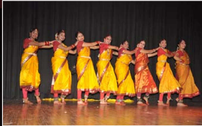
ಎಲ್ಲಾದರು ಇರು-ಸಮೂಹ ನೃತ್ಯ