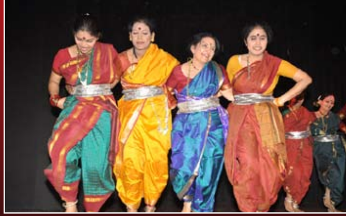
ಚಿಲ್ಲಿದರು ಮಲ್ಲಿಗೆಯಾ-ಜಾನಪದ ನೃತ್ಯ