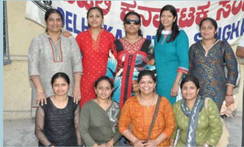
ತ್ರೋಬಾಲ್ ವಿನ್ನರ್-ತ್ರೋಬಾಲ್ ಸೂಪರ್ ನೈನ್ ತಂಡ