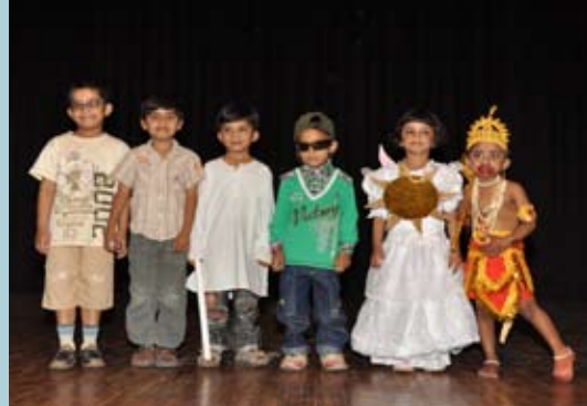
ಭದ್ರವೇಷ, ಸ್ಪರ್ಧೆಯಲ್ಲಿ ಭಾಗವಹಿಸಿದ ಪುಟಾಣಿಗಳು