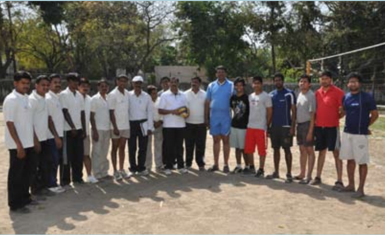
ವಾಲಿಬಾಲ್ ವಿನ್ನರ್ ಎವರ್ ಗ್ರೀನ್ ತಂಡ ಹಾಗೂ ರನ್ನರ್ಸ್ ಬೆಳ್ಳಿಯಪ್ಪಾಸ್ ಗ್ರೂಪ್