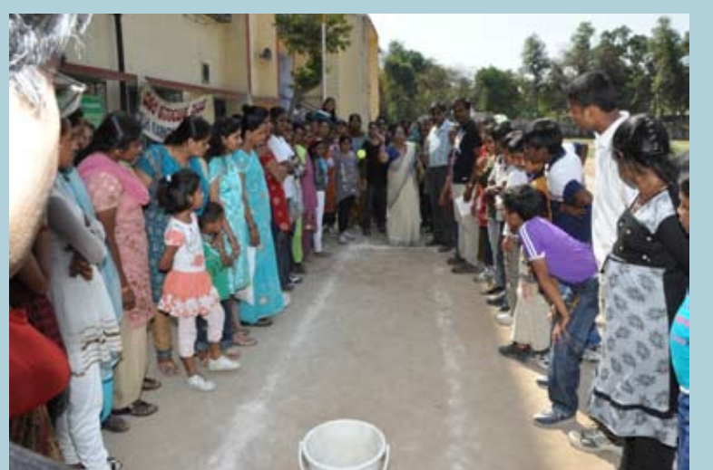
ಬಕೆಟ್‌ಗೆ ಚಿಂಡು ಹಾಕುತ್ತಿರುವ ಸ್ಪರ್ಧಿಗಳು