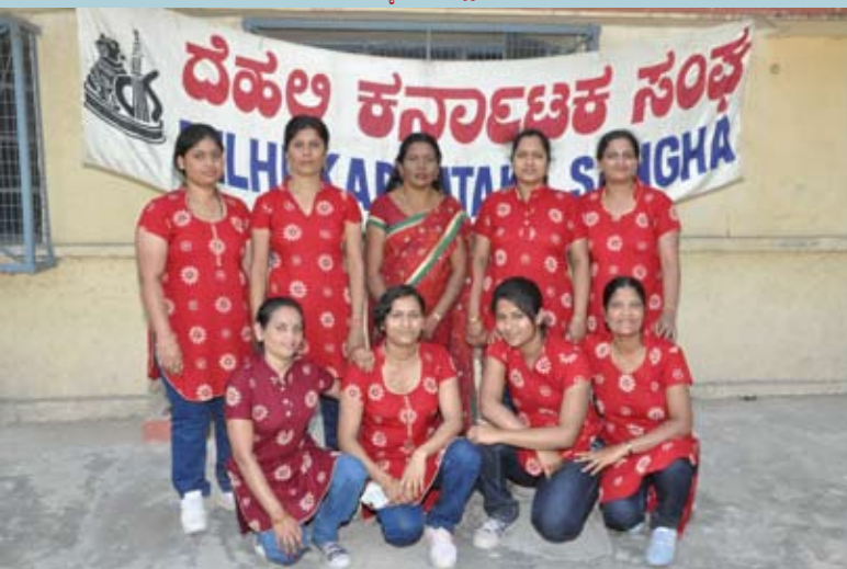
ತ್ರೋಬಾಲ್ ರನ್ನರ್-ದೆಹಲಿ ಪೋಲಿಸ್ ಕನ್ನಡಿಗಾಸ್ ವೆಲ್‌ಫೇರ್ ಅಸೋಸಿಯೇಶನ್ ತಂಡ